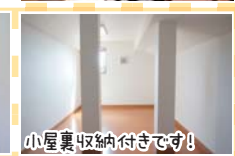
小屋裏収納付きです!