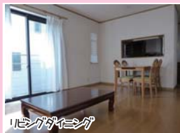
リビングダイニング