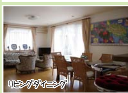
リビングダイニング