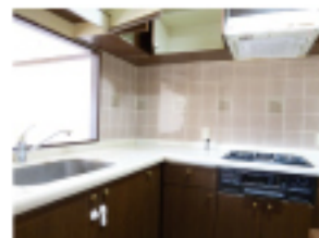
カウンターキッチン