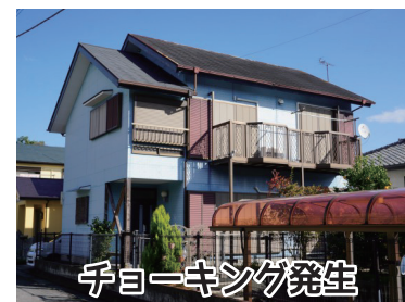
チョーキング発生