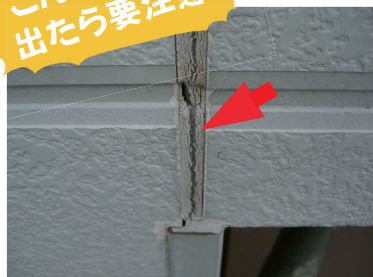
コーキングの劣化