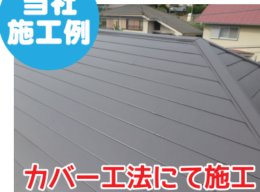
カバー工法にて施工