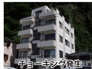
チョーキング発生