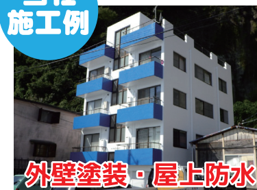
外壁塗装・屋上防水