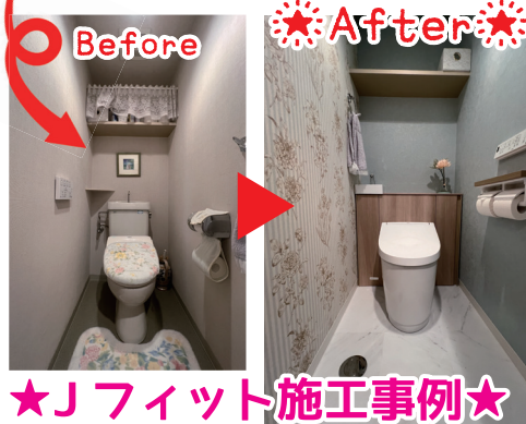
★Jフィット施工事例★