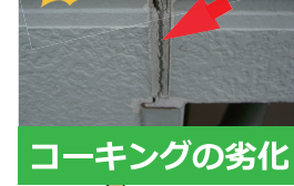
コーキングの劣化